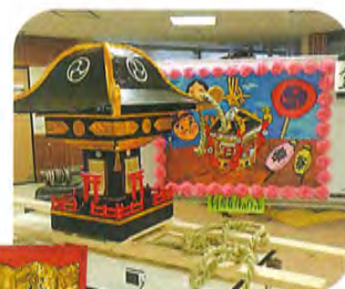
趣味の作品づくり